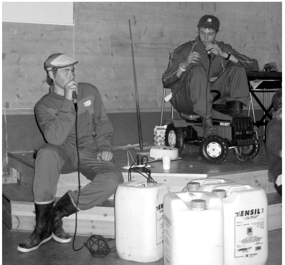
"Ok, så har du større traktor, men kånå mi e møyje større enn kånå di!"