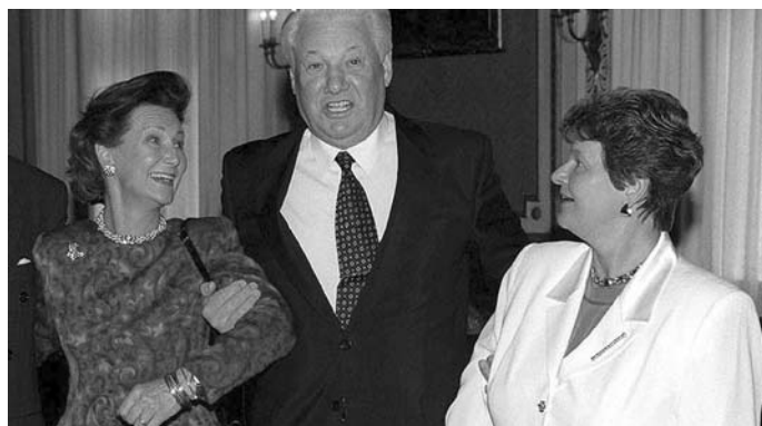
Ekspresident Boris Jeltsin har et godt håndlag me damene.