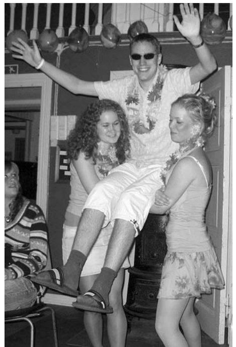
Av praktiske årsagar e mannfolkbering kun utbreidd i land som praktisere bigami.

Nå ser me i styret fram til å planleggja vårens fest.