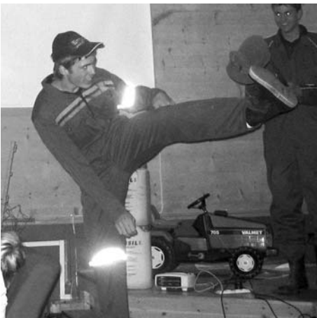
Terje tar Kalle Klovn-dansen sin

Folk møtte opp med traktor og kjele- dress. Med inngangsdøra blei gjestane møtt med melkecocktail. Fram til klokka ni blei det spelt country og mykje bon-