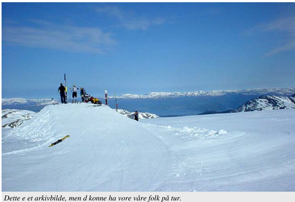
Dette e et arkivbilde, men d kunne ha vore våre folk på tur.

den siste dagen så alle (nesten) ville opp tiligast mulig for å utnyttat dagen. Alle pakka fort å gale så me kãm oss av gåre. Itte ein sjappe frokost reiste me. Denne dagen blåste d meir, så d va litt