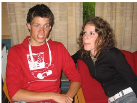
"Sjå! Sjå nå! Rikke eg på øyrene nå?"

Videre på min nysgjerrighetstur møtte eg fleire muntre smil, folk som potla på med sitt, og i kjøkkenkroken blei kveldens leker lagt heilt klare. Då klokka runda tjuuein va det klart for å starta arrangementet offisielt, någe som blei gjort på ein rørende fine måte, nemlig med songinnslaget eg hadde fått