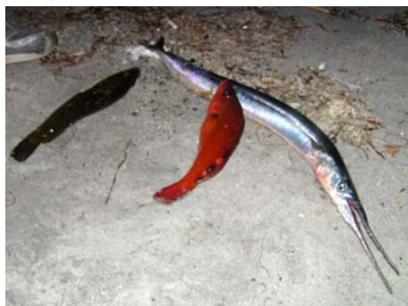
"Kan me bytta den lange stygge i 5 brø?"

blei folk delt inn i lag på fem og fem åsså va d bare for laga å finna seg en goe fiske plass. Alle laga hadde ca en time på seg å fiska, så her va det bare å komma i gang og finna den beste fiskeplassen.