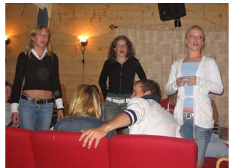
"Me låve å aldri skriva kos me z meir. Me låve å aldri..."

Mens me vridde hjernane våre konne me sitta og putta innpå nyplukka jordbær, herlig! Sånn, då va hjernane våre trimte nok og det va på tide å testa songstemmen og gjette kunsten: det va klart for mimelek og songlek, juhu! Å detta tok av! Adle va heilt i skyene og totalt maks gira, fantastisk! Stemningå va som du forstår heilt på topp heile kvellen. Hooh, her skjedde der masse kjekt!