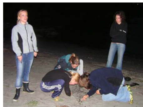
"5 789 568 sandkorn, 5 789 569 sandkorn, 5 789 6.. Fadderullan, nå myssta eg tellingå!"