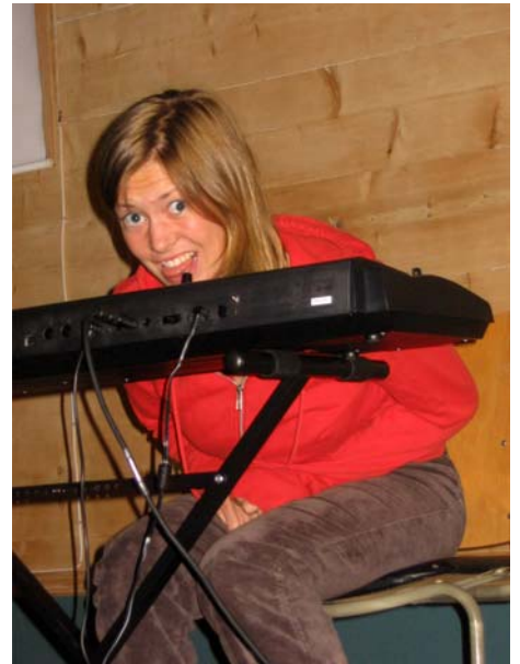
"Ka?! Eg presse jo alt eg kan!"

begynna på nytt igjen. Så her gjaldt det om å holda tongå beint i monnen og ikkje la seg forstyrra av det som skjer rundt seg. Utruligt kjekt!