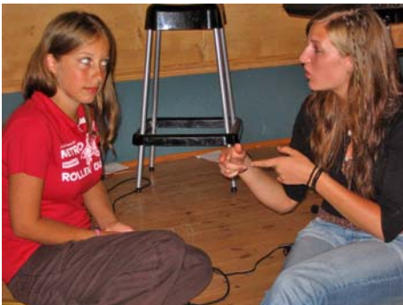
"Ja, åsså akkurat når eg sgo parkera atme bilen din, sånn, så stupte d ner ei måga å lagte den ribå i lakken din... Hæ? Nei, d e heilt fakta!"

Som oppvarming hadde me "fleip eller fakta" , som gjekk høglytt for seg mjudlå dei to lagå. Når adle va varme i trøyå bar det øve på leken som ga denne jentå svar på sine mange undringar: su doku...A- ha! Su doku e ein tal lek som e i ferd med å fortrenge det tradisjonella kryssordet i engelske aviser. Alle rekker, kolonner og 3*3 felt på brettet må inneholda talå 1 til 9., å det fins kun ein løysning! Et svært innvikla, spennande og utfordrane kryssord som du fort bler hekta på! Å det ska lite te for at du må