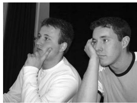
Idrettsgale: Entusiastiske fotballtilskuere