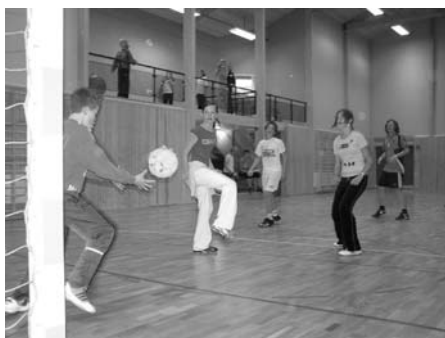
Fotballdrama: Vinjarcupen 7